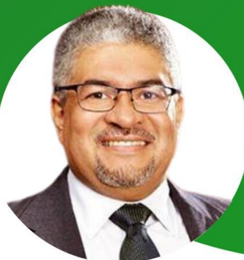
Lic. Carlos Montero

Presidente de la Conferedación de Cooperativas del Caribe, Centro y Sudamerica (CCC-CA).